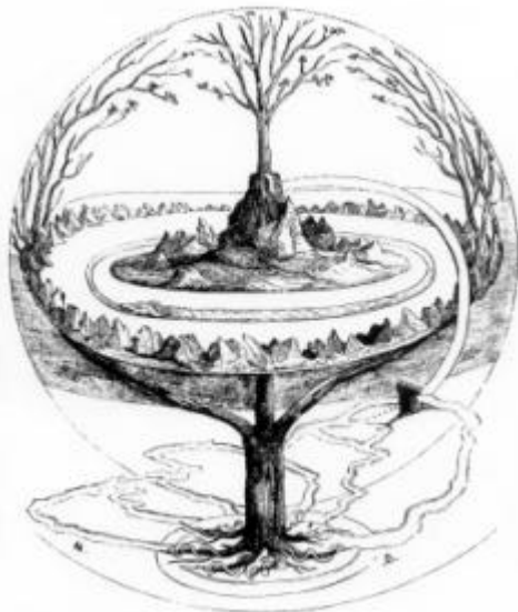
Abb. 5: Der Aufbau der Welt nach nordgermanischer Überlieferung

Ich hatte oben bereits erwähnt, dass man die Weltesche der nordischen Quellen mit ähnlichen Überlieferungen eines Weltenbaums verglichen hat, die in weiten Teilen Eurasiens anzutreffen sind. Mit diesem Baum ist häufig die Vorstellung verbunden, er stünde im Zentrum der Welt und verbände die verschiedenen Schichten (Unterwelt, Erde, Oberwelt) eines vertikal gegliederten Kosmos. Auch erfüllt er die Funktion, diese verschiedenen Schichten auseinander zu halten (Abb. 5). Dass wir diese Vorstellung auch bei den Germanen voraussetzen können, zeigt der Bericht des Rudolf von Fulda ( Translatio Alexandri ) über die 772 von Karl dem Großen zerstörte irminsûl , dem zentralen Heiligtum der heidnischen Sachsen. Er nennt sie eine universalis columna, quasi sustinens omnia ('eine Weltsäule, gleichsam alles tragend').