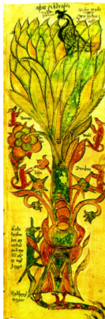
Abb. 3: Die Weltesche Yggdrasil aus einer isländischen Handschrift von 1680 (AM 738 4 ov )