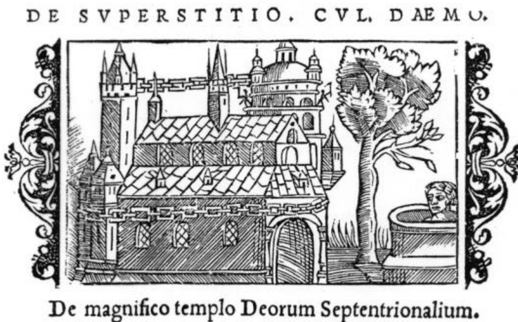
Abb. 4: Der Tempel mit Baum und Quelle in Uppsala; Holzschnitt aus der 'Geschichte der mitternächtigen Völker' (Rom 1544) des Schweden Olaus Magnus

Nahe diesem Tempel steht ein sehr großer Baum, der weithin seine Äste ausbreitet, die im Sommer wie im Winter stets grün sind. Keiner kennt seine Art. Dort befindet sich auch eine Quelle, an der die Heiden zu opfern und in der sie einen lebenden Menschen zu versenken pflegen.